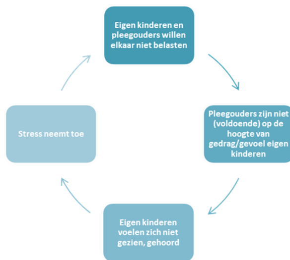
Figuur 1: Vicieuze cirkel spanning pleeggezin M. Split, 2018

een vicieuze cirkel van oplopende spanning en stress ontstaat in het pleeggezin. Dit is zichtbaar gemaakt in onderstaande afbeelding.